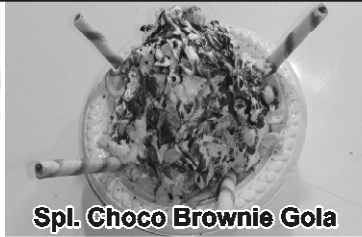
Spl. Choco Brownie Gola